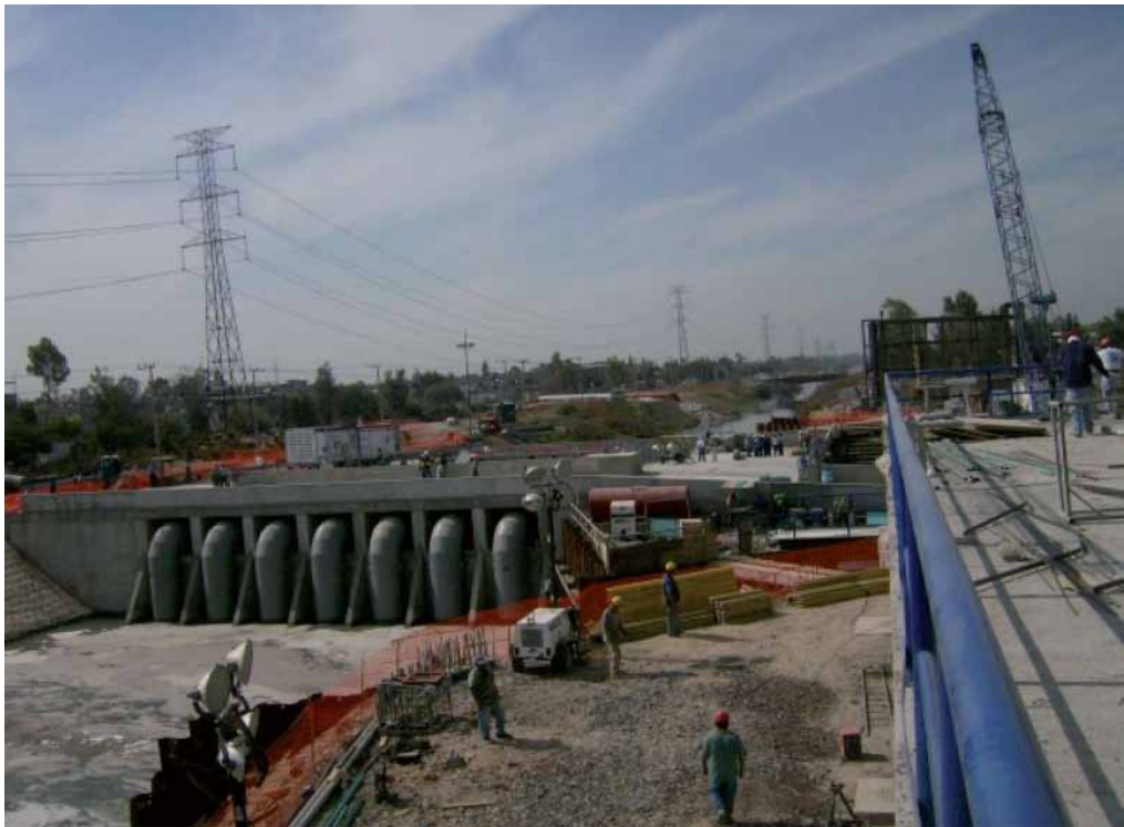
Planta de Bombeo Gran Canal km 11+600

Aunque estas obras no resuelven de manera definitiva el riesgo de inundación del Valle de México, sí lo reducen.