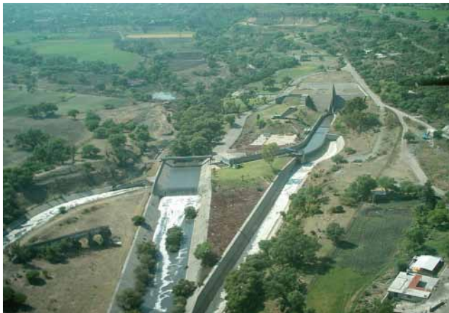
Portal de salida del Emisor Central Atotonilco de Tula, Hidalgo

En otras entidades federativas se van a construir grandes plantas de tratamiento con la participación conjunta de la Federación y los gobiernos locales, que contemplan modernos esquemas de financiamiento y aseguran su viabilidad económica. Destacan entre ellas las dos de la zona conurbada de Guadalajara, Jalisco, que por su capacidad conjunta de 10.8 metros cúbicos por segundo serán las mayores después de las del Valle de México.