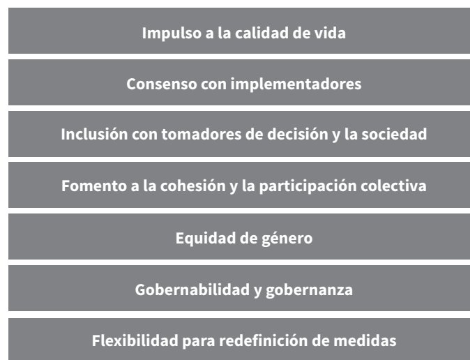
FIGURA 1 PRINCIPIOS RECTORES DEL PACCM 2014-2020

Se extendió en dos años la duración del programa con la finalidad de establecer un período de transición que permita tanto evaluar el programa vigente como diseñar el siguiente.