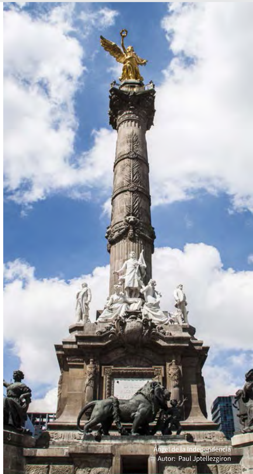
Ángel de la Independencia Autor: Paul Jptellezgiro

A manera de conclusión puede decirse que el PACCM 2014-2020 busca fortalecer la política climática de la Ciudad de México y se espera que contribuya en gran medida a dirigir a la Ciudad hacia un desarrollo bajo en carbono y verdaderamente sustentable.