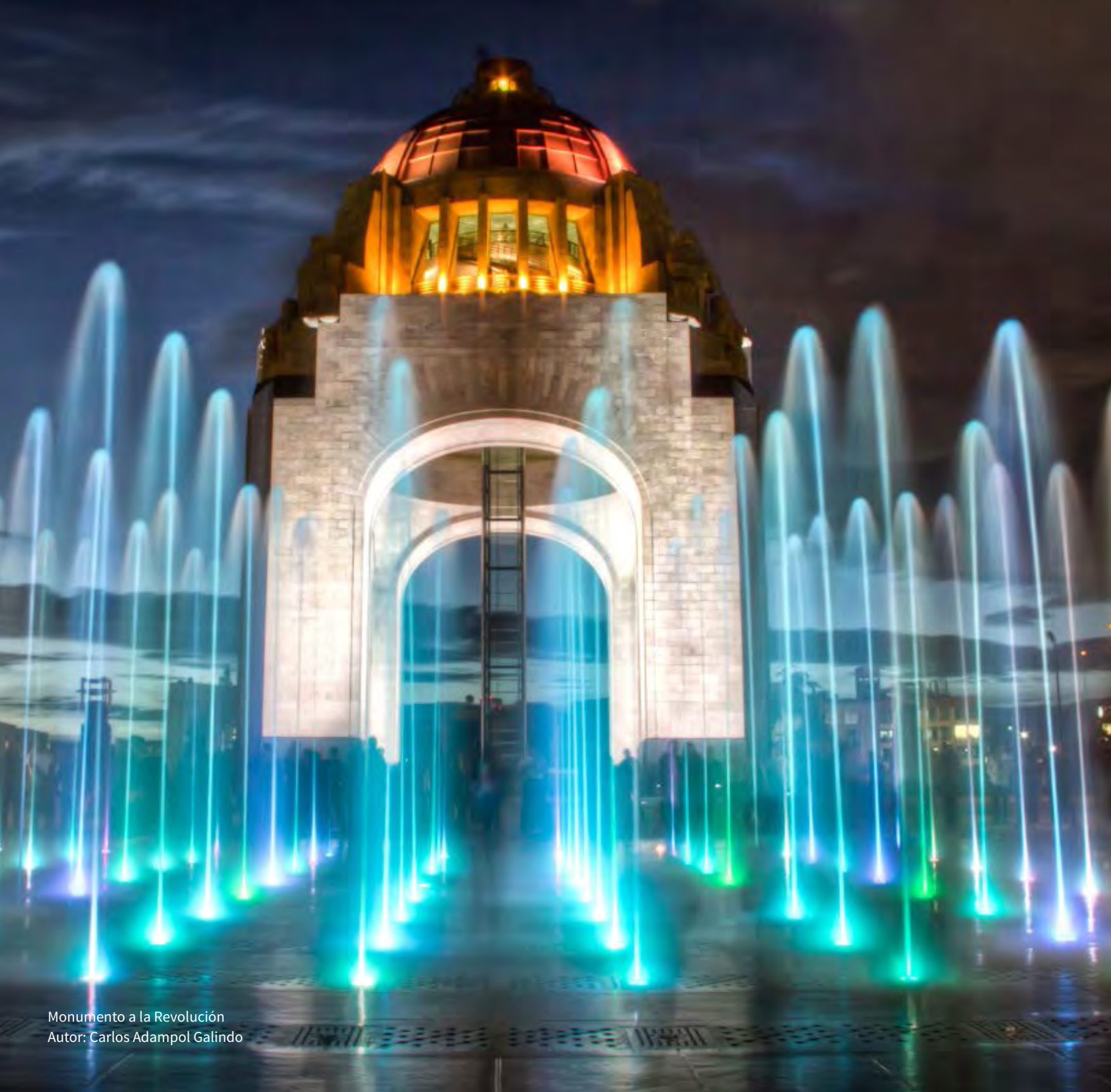
Monumento a la Revolución Autor: Carlos Adampol Galindo