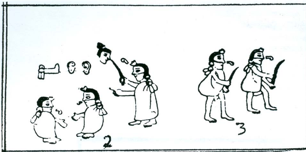
Figura 3 LOS COLHUAS PIDEN AYUDA A LOS MEXICAS PARA VENCER A LOS XOCHIMILCAS

Cuando los mexicas tenían que entregar a los prisioneros, solo entregaron las orejas, eso asombro al rey culhua pero disimulando les permitió entrar a su ciudad, comerciar y emparentar por vía de matrimonio. Pero aun así ellos volvieron a Comtitlán y habitaron ahí no más de treinta años, en los cuales lograron reproducirse y consolidarse hasta que Tenoch, su supremo sacerdote, avisa que tienen que prepararse para salir de ahí; algunos se esconden en otros lugares y otros se quedan viviendo por la zona.